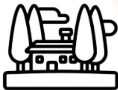
Resorts, Hóteis e Moradias